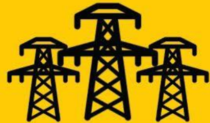
PEMBANGUNAN INFRASTRUKTUR KETENAGALISTRIKAN