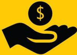
DANA SUBSIDI LISTRIK